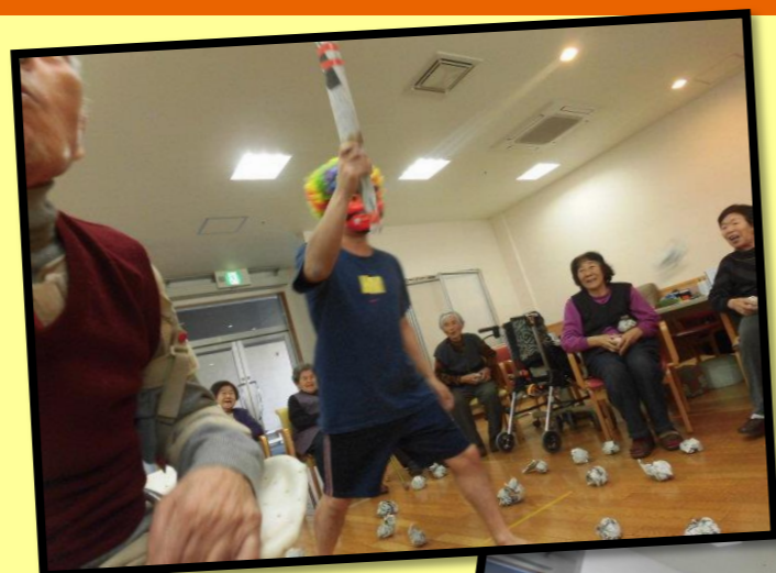
「豆まきレク」 2月3日 実施

3月に入り段々と暖かくなってきました。皆様いかがお過ごしでしょうか?今回紹介する写真は、2月3日に実施された節分の豆まきレクの様子です!新聞紙を丸めて作った豆を、鬼の格好(?)に扮した職員に目一杯投げいただきました!!日々のストレス解消にもなった...かも?鬼を追い払って、今年も病気やけがない一年を送っていただくことを、職員一同も願っております!今月も元気に過ごしていきましょう!